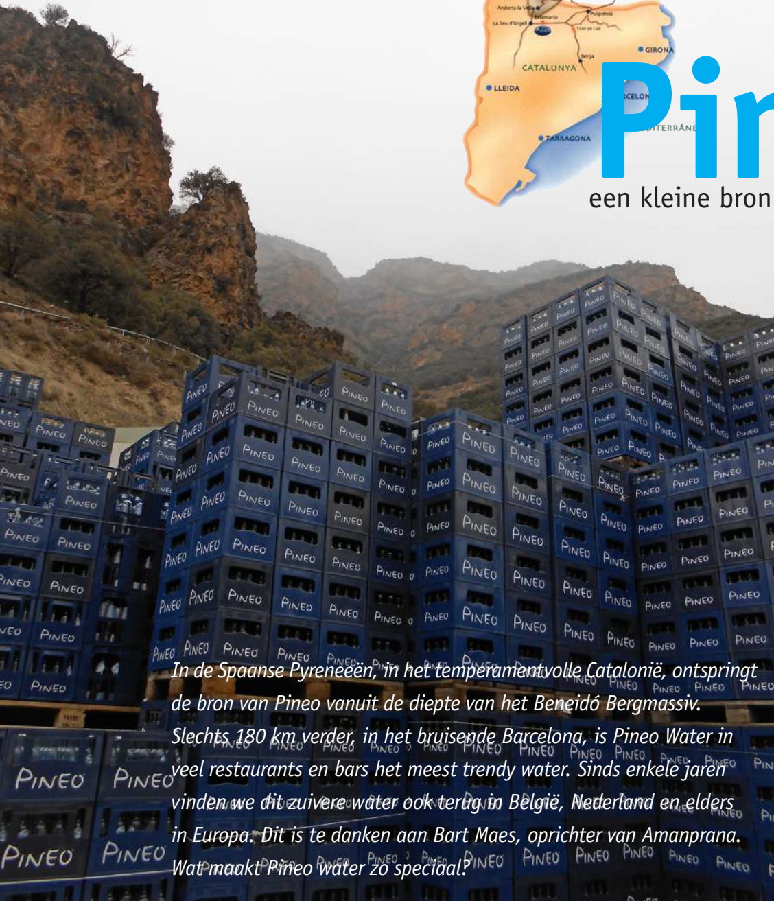
Nabije omgeving van de Pineo bron